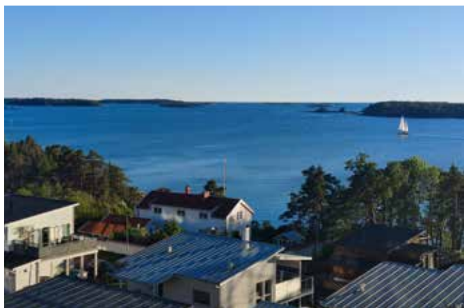
Det havsnära Horelli-området bjuder på utsikt över inloppet till Mariehamn. Här finns både hyreslägenheter och bostadstomter.

I Mariehamn finns allt du behöver samlat. Trevliga bostadsområden, shopping i en unik stadskärna, omtyckta restauranger och caféer, ett stort utbud av kulturupplevelser samt ett stort antal företag och arbetsplatser inom olika branscher.