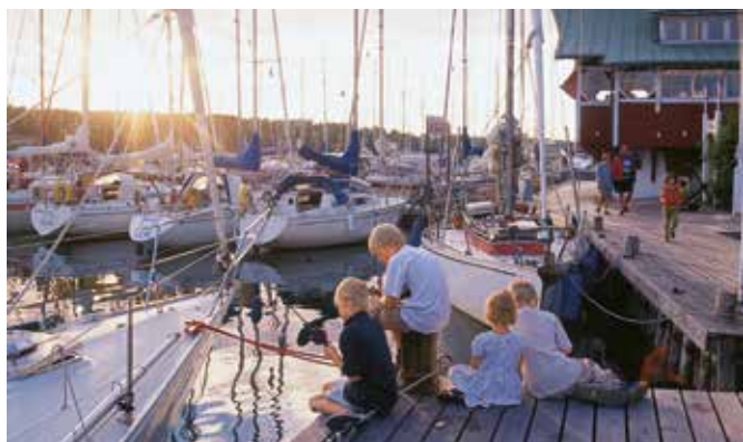
I Mariehamn finns två stora gästhamnar och flera småbåtshamnar där boende kan hyra båtplats.

Omgiven av havet bjuder Mariehamn på allt från fina vyer till bad vid fyra sandstränder och badhuset Mariebad.