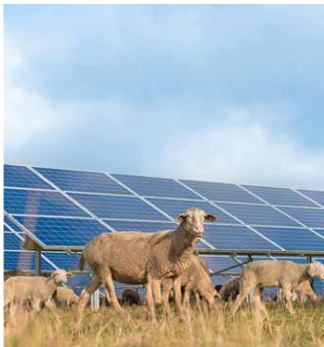
OX2 driver den gröna omställningen på Åland.