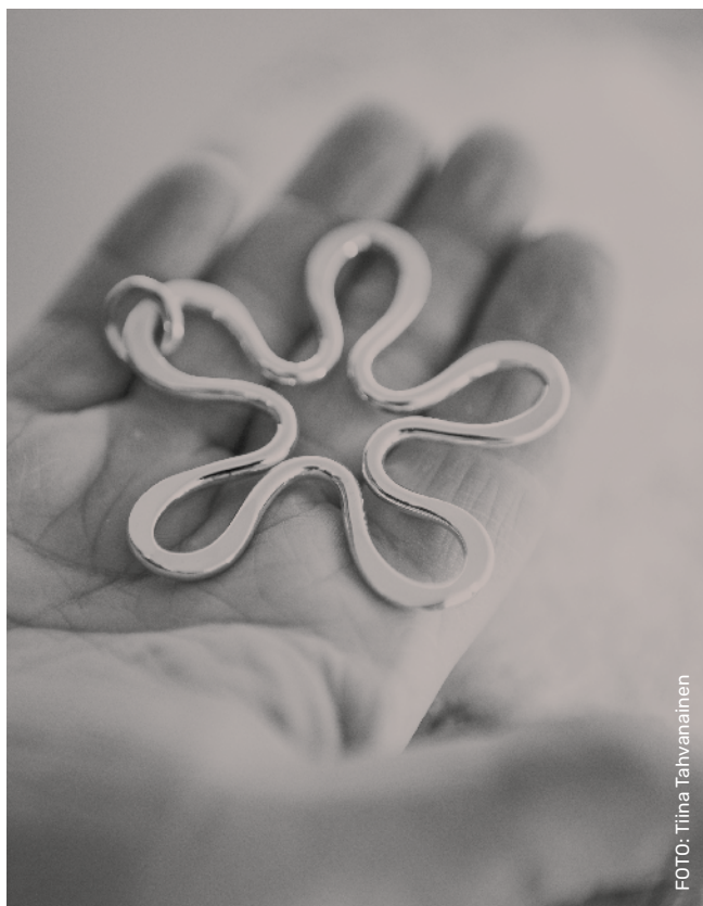
Varje smycke tillverkas för hand i Guldvivas verkstad. Formen på Blommans™ kronblad sitter i guldsmedens händer.