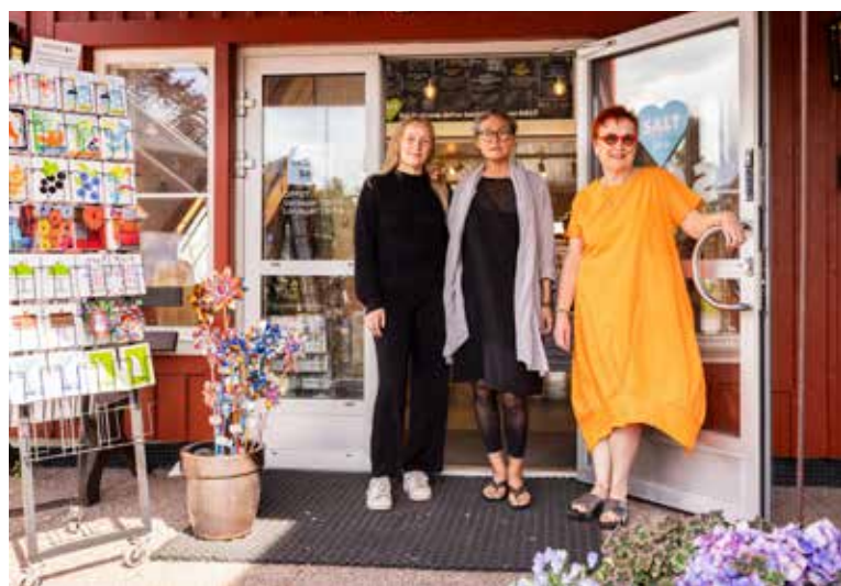
SALT är den största butiken på Åland med enbart åländskt konsthantverk, mathantverk och design. Öppet året runt.

SALT GILLAR LIV OCH RÖRELSE och deltar gärna i olika evenemang, som vårens tjärmarknad i Sjökvarteret, omtyckta höstevenemanget Skördefesten på Åland eller i Sjökvarterets julmarknad. Då öppnar också Café SALT, alltid med gott hembakt och ofta ackompanjerat av svängig musik.