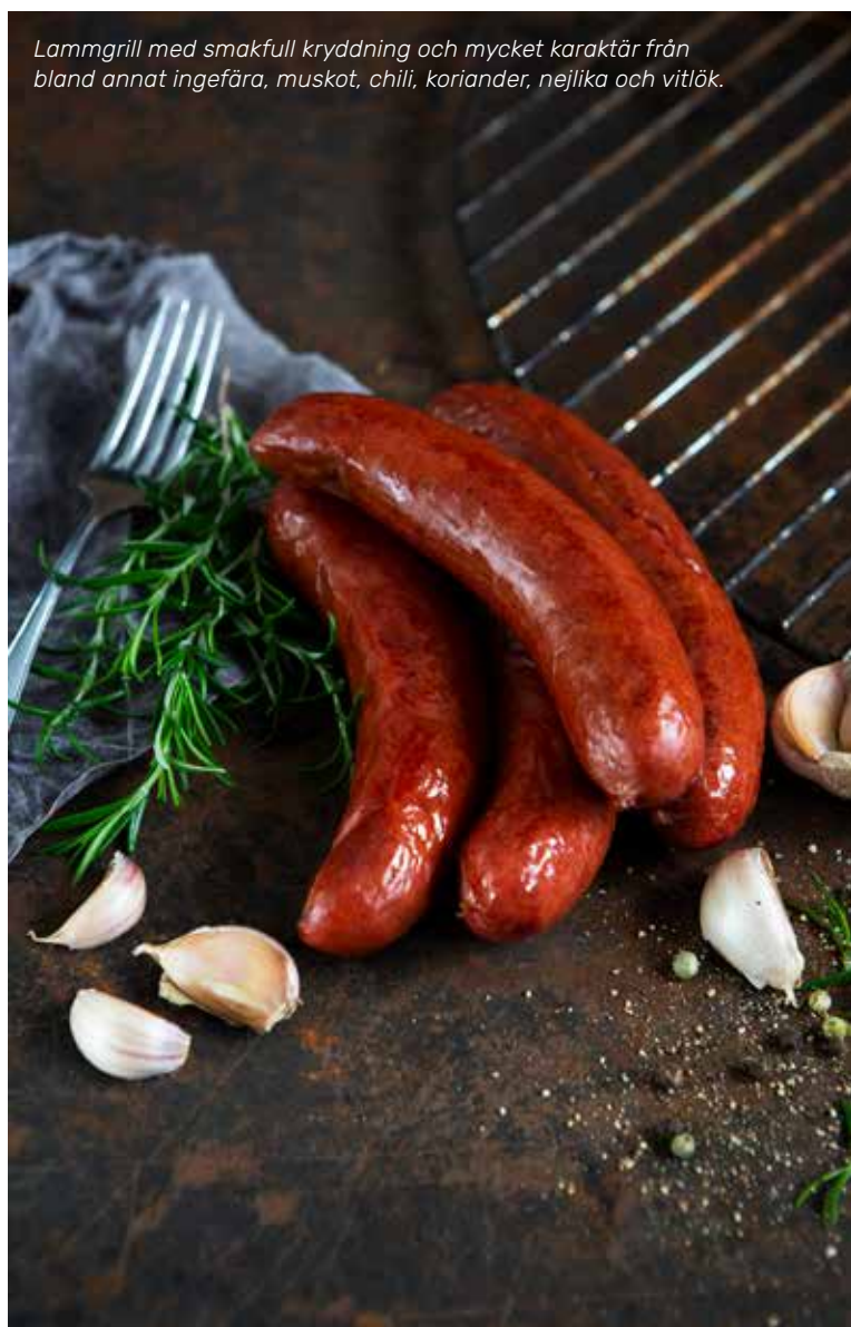
Lammgrill med smakfull kryddning och mycket karaktär från bland annat ingefära, muskot, chili, koriander, nejlika och vitlök.

Karlbergsvägen 5, Mariehamn +358 (0)18 528 000, info@dahlmans.ax www.dahlmans.ax