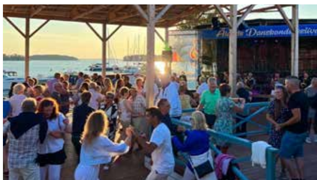
Countrytorget och dansbandsfestivalen lockar många återkommande besökare, och det är lätt att förstå varför.