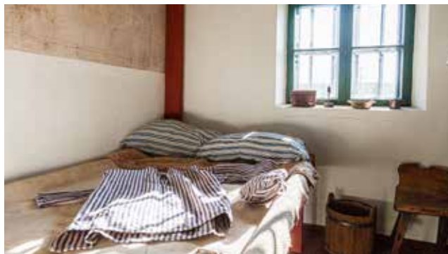
Stora kontraster mellan fångarnas celler i fängelsemuseet Vita Björn till gårdsidyllen vid Jan Karlsgården.