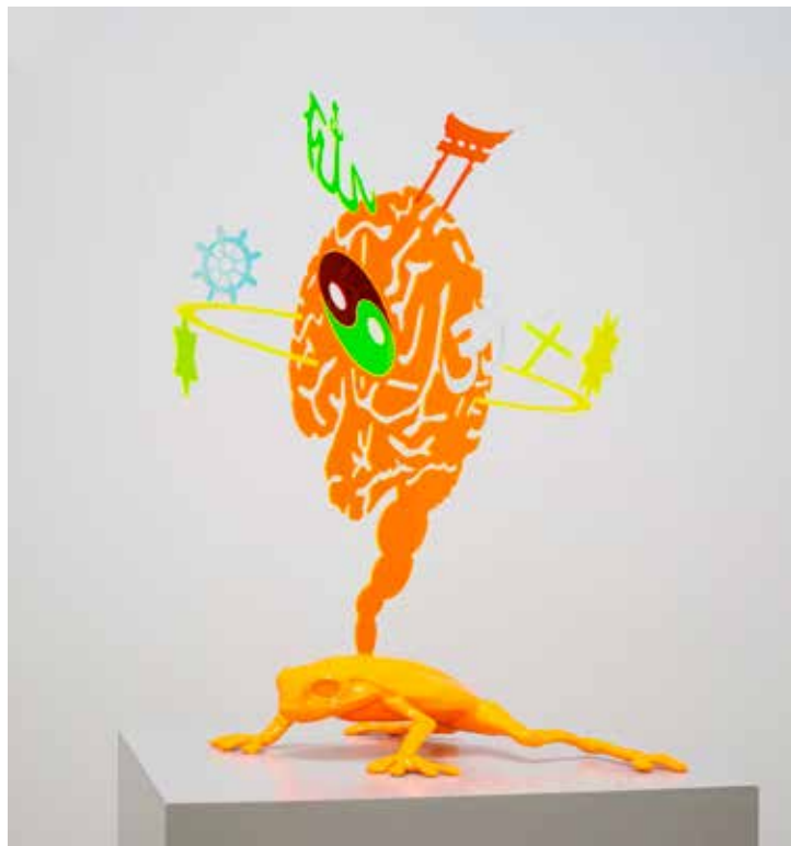
HC Berg, f. 1971 Whats your bubble –Multiverse I , 2022 Mixed plastics media, 34 x 27 x 46 cm