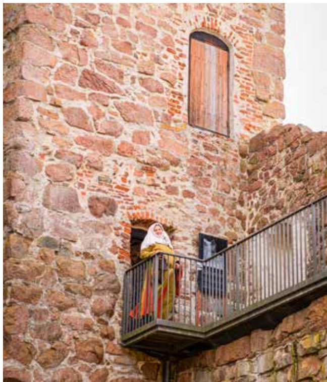
Under högsäsongen är det guidade turer i slottet varje dag, vilket är uppskattat bland besökarna.