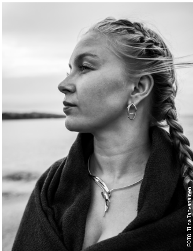
Vattnet är det viktigaste. Stormskärs Maja-kollektionen bidrar till John Nurminens Stiftelses havsängsprojekt.