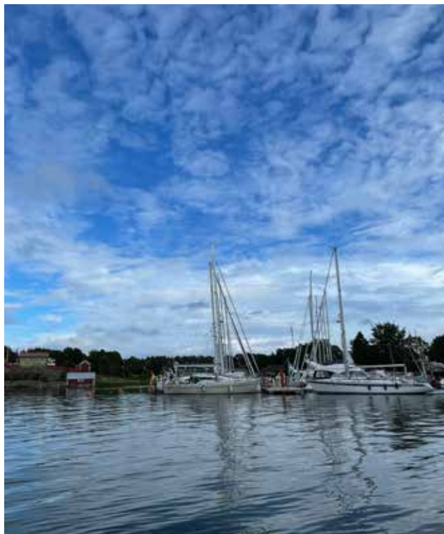
Ta skärgårdsfärjan från Svinö eller besök Föglö med egen båt. I Degerby finns två fina gästhamnar.