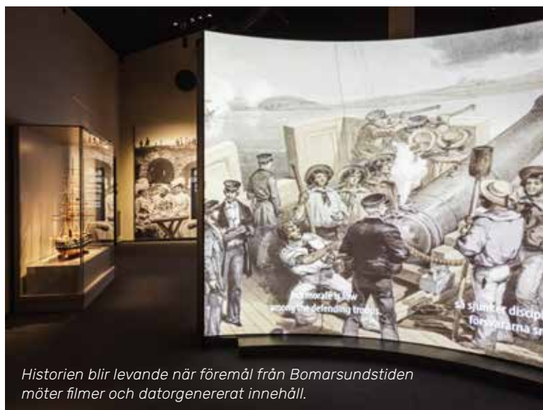
Historien blir levande när föremål från Bomarsundstiden möter filmer och datorgenererat innehåll.